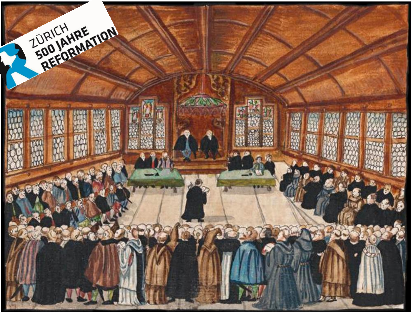
Disputation im alten Zürcher Rathaus 1523. Späteres Bild aus der Reformationschronik von Bullinger/Haller (zwischen 1611 und 1614)